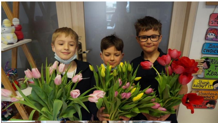
Niespodzianki od chłopców na Dzień Kobiet